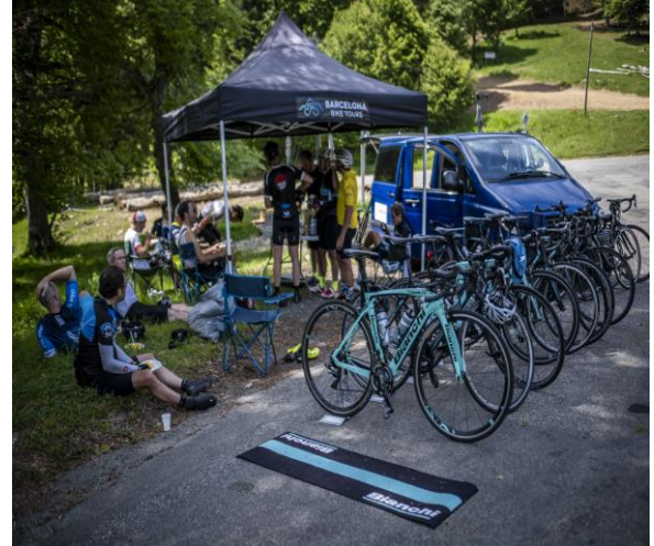
Servicio personalizado en ruta