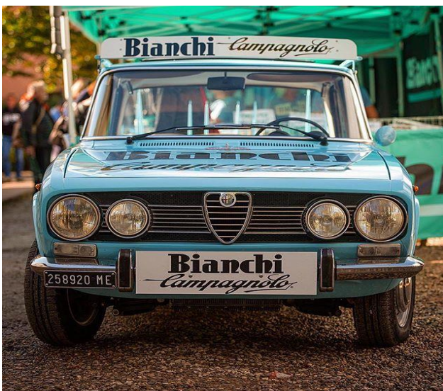
Una experiencia "Vintage"