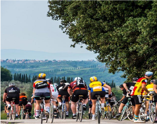
El mejor ambiente cicloturista